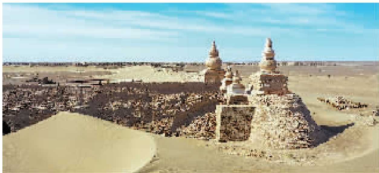
这是黑城遗址(6月2日摄)。

黑城又名黑水城,位于内蒙古自治区额济纳旗。该城建于公元九世纪,为西夏王朝“黑山威福军司”所在地,元代设亦集乃路总管府。黑城遗址于2001年被列入第五批全国重点文物保护单位。