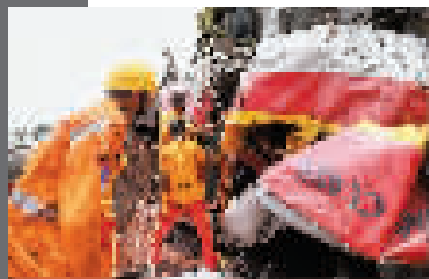
3日,救援人员在列车脱轨相撞事故现场工作。