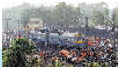
6月4日,救援人员在印度奥迪沙邦巴拉索尔地区的列车脱轨相撞事故现场工作。