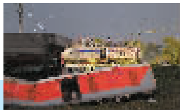
6月4日,在印度奥迪沙邦巴拉索尔地区拍摄的列车脱轨相撞事故现场。