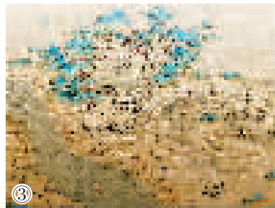
图①、②、③分别为《漕运图》北京界、天津界和杭州界。