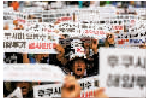
上图 6月12日,民众在韩国首尔手举标语牌参加集会,反对日本核污染水排海。