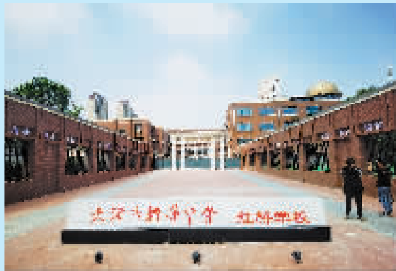
耀华中学红桥学校外景。