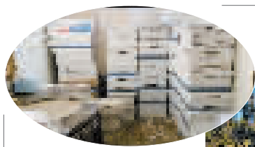
↑堆放在海湖庄园一个房间内的存放文件的箱子。视频截图

得克萨斯州19日热浪滚滚,气温突破37摄氏度,一些地方发布超高温预警,预计高温情况至少要持续到21日。欧飒(据新华社电)