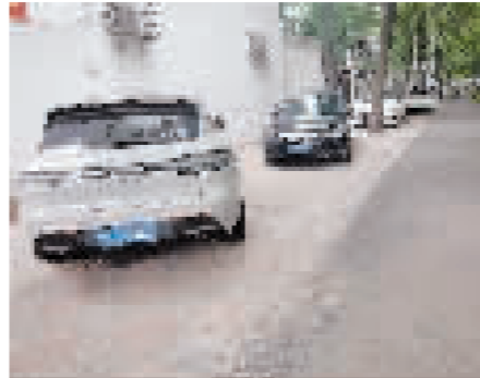
占压人行道、盲道停车。

口,经常有司机为了图方便,把车停放在车行道上。记者在六纬路与十一经路交口附近的一个医院门口看到,一些来医院就医、送货的车辆停靠在路口的车行道上,占用整条右拐道,使得在路口右拐的车辆不得不绕行左侧车道,造成路口秩序十分混乱。在马路的另一侧,同样存在机动车占用车行道的问题,正常行驶的机动车不得不借道行驶。红桥区海源南道的路面本就狭窄,每天都有摆摊的商贩占用路边停车位摆摊。早晚