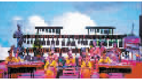
今年4月,湖北省博物馆编钟演奏。

在湖北省博物馆新建成的编钟演奏厅,清脆悠扬的编钟之声,久久回旋;婀娜曼妙的舞姿,演绎楚国宫廷宴乐场景,再现先秦时期中国古代音乐文化视听盛宴,让观众沉醉流连。