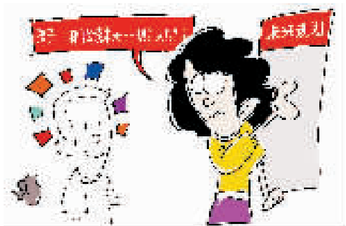
考后直面未来规划 卓文 绘

●今年的高考和中考相继结束,考生们的心理压力一下子释放了。怎样过好大考之后最轻松的这个暑假呢?是来一场早就在计划之内的旅行?是与同伴相约看电影、打游戏?还是在放松之余,对新学段多一些了解?相信每位考生心里都会有自己的目标和规划。