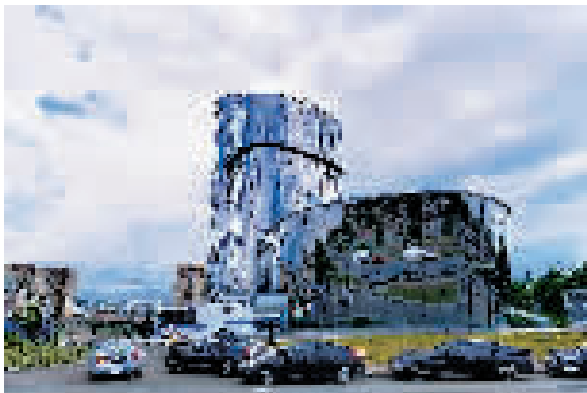
图为24日在圣彼得堡拍摄的被封锁的瓦格纳总部