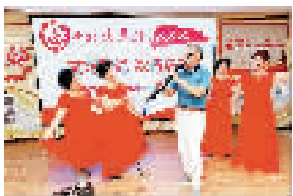
本市和平区朝阳里社区举办活动,联络邻里感情,增强社区凝聚力。

出于经济方面的考量,拥有房产以及希望通过出租、出售房产而获益的人群往往倾向于“为城市留人”。本次调查