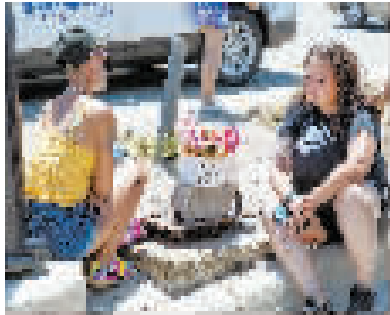
7月4日,人们在美国得克萨斯州沃思堡枪击事件现场附近哀悼遇难者。

管”枪支暴力。民主党籍费城市长吉姆·肯尼在4日的新闻发布会上说:“我们恳求国会保护生命,对美国的枪支问题有所作为。”