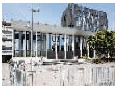
6月30日在法国北部小城蒙桑巴勒拍摄的骚乱中被破坏的市政厅。