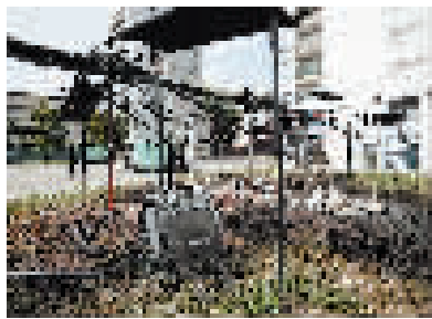
6月30日,在法国上塞纳省楠泰尔市,一家餐馆的室外用餐区被焚毁。

这已不是美国今年首个高温天徒步死亡案例。国家公园管理局6月通报,一对父子在大本德国家公园徒步后死亡,出事当天当地最高温度超过48摄氏度。王鑫方(据新华社电)