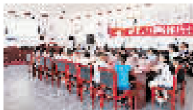
暑期安全自护教育活动现场。