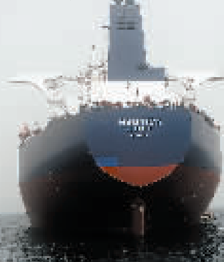
17日，“诺帝卡”号大型油轮停泊在也门荷台达省附近海域。

新华社开罗7月17日电(记者王尚)萨那消息：联合国方面17日向也门胡塞武装移交了一艘油轮，以转移面临严重老化问题的“萨菲尔”号储油巨轮上的约110万桶原油。