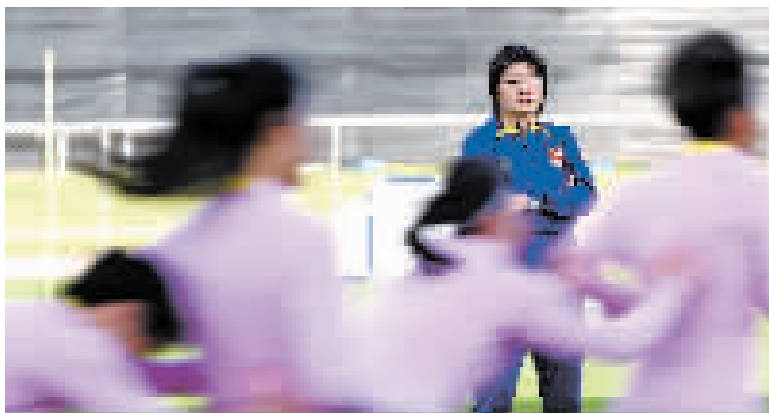
中国女足主教练水庆霞(后)18日在场边指导备战。