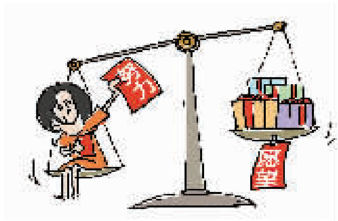
付出努力 实现愿望 卓文 绘

每个孩子都希望暑假期间可以实现很多愿望。许女士家有两个孩子。刚放暑假时,姐妹俩凑在一起嘀咕半天,最后拿给