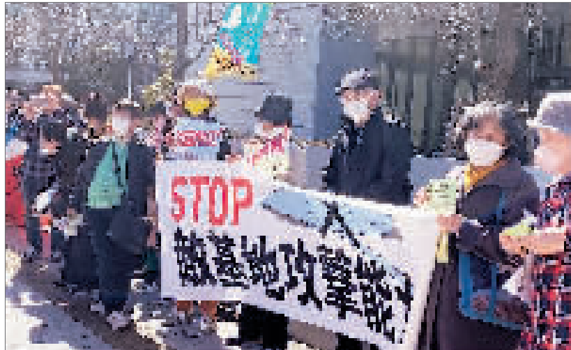
2023年2月28日,在日本东京,日本民众举着标语牌抗议日本众议院通过高额的防卫费预算案。新华社记者 郭丹摄

在探讨“异次元少子化政策”最后会不会因缺钱而不了了之时,政治评论员伊藤淳夫说,“先喊出一个口号、高高地举起标语,后面的事情慢慢再说”,“这样的事情岸田干过很多次了”。