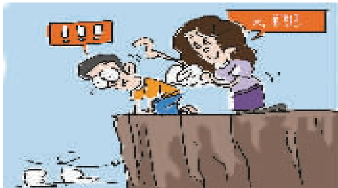
单飞旅行要循序渐进 卓文 绘

●假期里,面向小学生举办的名目繁多的训练营、研学营、单飞旅行团吸引了不少家长的目光。有家长觉得让孩子独自出行能开拓眼界,还可以培养孩子的独立性。但是让低龄孩子单飞旅行,真的能让家长实现教育愿望吗?孩子的收获又有多少呢?