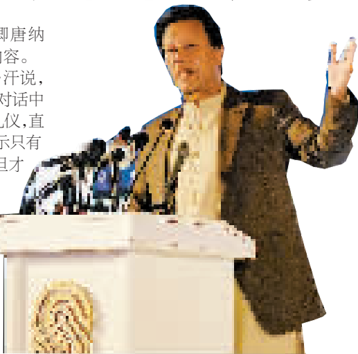
2020年2月17日,在巴基斯坦伊斯兰堡,巴基斯坦时任总理伊姆兰·汗在阿富汗难民问题国际会议上发表讲话。