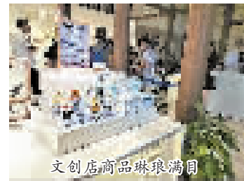
文创店商品琳琅满目

书签、镂空金香囊球摆件……每一个产品都能吸引人们拿起来端详,几乎没有人空着手离开,买完之后还美美地拍上一张,朋友圈一晒点赞无数。“打卡”博物馆,收集文创周边逐渐成为年轻群体的生活方式。