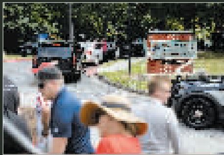
24日,人们聚集在富尔顿县拘留所外。