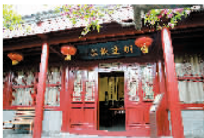
天津李叔同故居纪念馆内还原的桐达钱庄