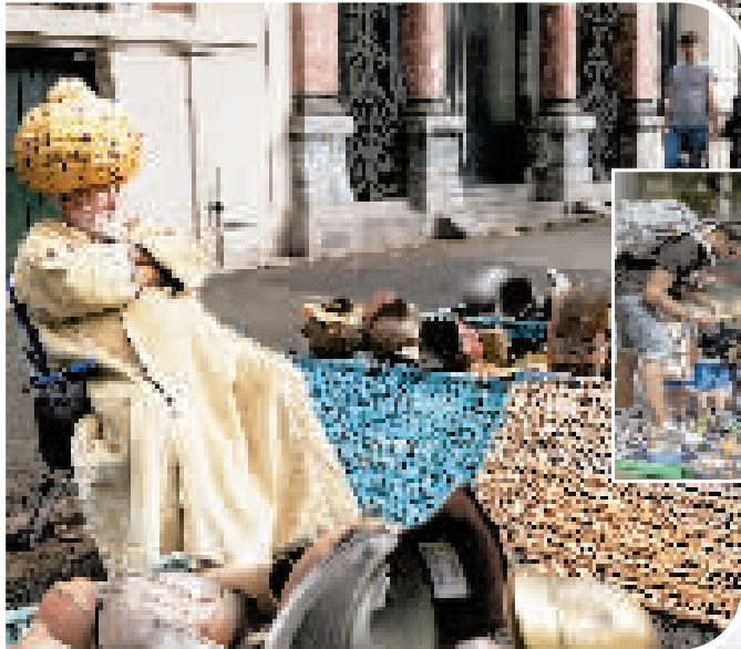
图为2日拍摄的里尔市旧货市场。

里尔旧货市场的历史可上溯到15世纪,当时老百姓每年都有机会拿家中的旧货到市场上出售,这一传统一直延续到今天。如今,里尔旧货市场在每年9月的第一个周末举行。