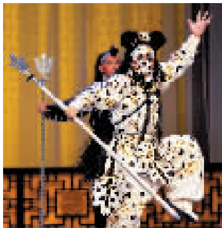
图为王一在《金钱豹》饰演金钱豹。