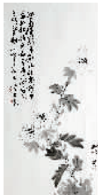
●雅舍谈艺 残菊图 吕献峰 绘画 唐云来 题诗