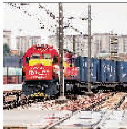
10月8日,“沪滇·澜湄线”国际货运班列驶出昆明市王家营西站。

当日,满载着东南亚水果、橡胶等产品以及云南特色商品的货运班列,从云南省昆明市王家营西站驶出,预计82小时后抵达上海。这标志着“沪滇·澜湄线”国际货运班列正式开行。它连接起我国东部沿海、内陆地区、西部边境与东南亚国家市场,提高了中老铁路运力,降低了货物运输成本,有力带动铁路沿线地区经贸发展。