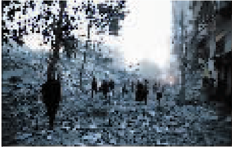
7日,巴勒斯坦民众在加沙城查看以色列空袭后损坏的民宅。