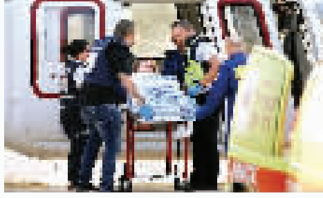
7日,在以色列南部城市阿什凯隆,伤者被直升机转运接受治疗。

以色列和巴勒斯坦7日爆发新一轮军事冲突,巴勒斯坦伊斯兰抵抗运动(哈马斯)当天在犹太假日期间对以色列发起军事行动。以军则对加沙地带展开多轮空袭。