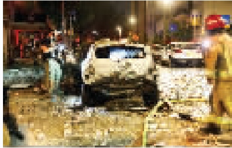
7日在以色列特拉维夫拍摄的一辆遭火箭弹破坏的车辆。