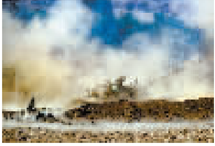
10月10日在加沙边境以色列一侧拍摄的集结的以军部队。