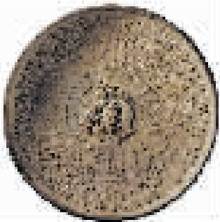
东罗马鎏金银盘

在甘肃省博物馆,有一件可以与绝世孤品铜奔马媲美的国宝级文物——东罗马鎏金银盘,它在中国国家文物局举办海外丝绸之路文物展中必不可少,也是全国各地文博机构邀约最为频繁的“嘉宾”,因此被称为馆中“最忙碌的文物”。