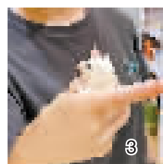
图1. 顾客在店内挑选宠物;图2. 趴在店员肩膀上的鬃狮蜥;图3. 店员手中的蜜袋鼯