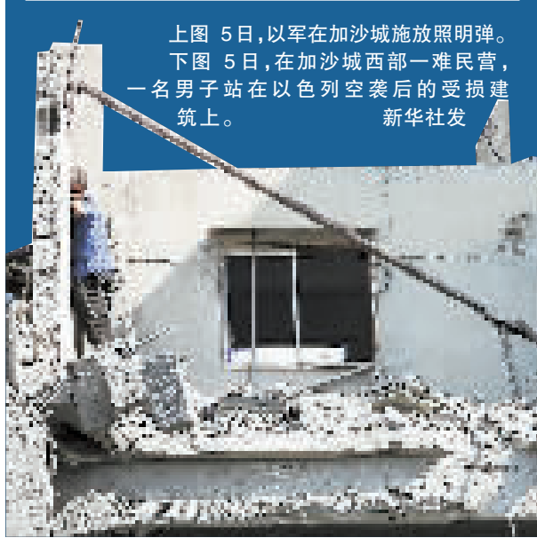
上图 5日,以军在加沙城施放照明弹。 下图 5日,在加沙城西部一难民营,一名男子站在以色列空袭后的受损建筑上。