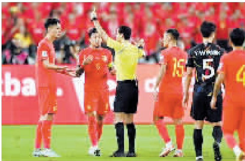
本场比赛中国队共领受四张黄牌。

本轮比赛过后,韩国队两连胜居首,泰国队和中国队同为二胜一负,前者暂以净胜球数优势位列第二。从此役新泰之战的整体走势来看,泰国队