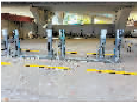
小区内飞线充电问题不少。

排充电桩,显示4个充电口闲置。记者来到这个超市的地下停车场发现,四个车位也全部被油车占用,根本没办充电。记者询问旁边洗车店工作人员,他表示,这几个充电桩长期被占用,没办法充电。