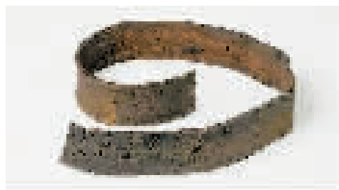
任弼时同志的半截皮带 (资料图片)