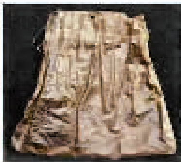
贺龙同志的长征渔具 (资料图片)

“1935年秋天,红四方面军进入草地,许多同志得了肠胃病,指导员派炊事班长照顾生病的三名小战士,这三名战士走不快,一路上,老班长带领生病的小战士走一阵歇一阵,到了宿营地,他就到处去找野菜,和着青稞面做饭。不到半个月,两袋青稞面吃完了。老班长看我们一天天瘦下去,他整夜整夜地合不拢眼。一天,他来到河边洗衣裳,忽然看见一条鱼跳出水面,他喜出望外地跑回来,取出一根缝衣针,烧红了,弯成个钓鱼钩。这天夜里,我们就吃到了新鲜的鱼汤。尽管没加佐料,可我们觉得没有比这鱼汤更鲜美的了,端起碗来吃了个精光”。