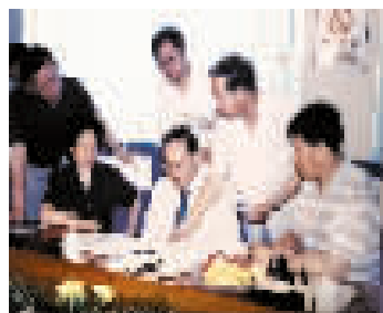
金庸了解天津水西庄研究成果

水西庄作为清代天津最负盛名的园林胜迹,虽已旧迹难寻,但天津人始终无法将它忘记。今年是水西庄建园300周年。这座曾经的运河明珠作为天津文化发展史重要的里程碑,永远值得人们关注。