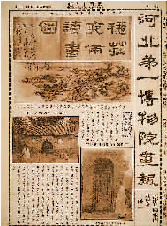
1933年《河北第一博物院半月刊》出版的水西庄专号

显。江南植物非常茂盛,富有天然野趣。园中种植了芭蕉、兰花、梅花、紫藤、竹子、海棠、垂柳等各种花卉树木。开阔的水面种植红菱碧莲,岸边绕以芦苇。根据《天津县志》描述,水西庄中水池环抱着亭台,翠竹、绿树在重重画楼之间若隐若现。暮春时节,飘落的花瓣纷纷扬扬洒满了台阶。每到夏季,池中出产红菱,香甜脆爽,娇嫩欲滴,是水西庄的特产。难怪《天津县志》称赞水西庄“水木清华,为津门园亭之冠”。