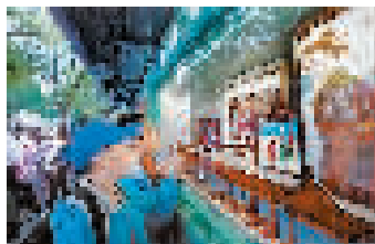
孩子们驻足在“墙上艺术馆”

“会说话”的围墙还将复刻进海淀街道的社区,让更多的“围墙”成为有“厚度”、有“温度”、可“阅读”、可“体验”的多功能复合型公共设施,激活城市公共空间。 孙颖 王海欣