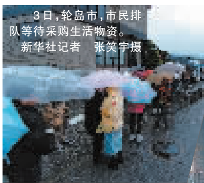
3日,轮岛市,市民排队等待采购生活物资。