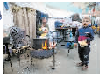
▲自新一轮巴以冲突爆发以来,以色列军队多次袭击加沙地带北部杰巴利耶难民营,造成大量伤亡。