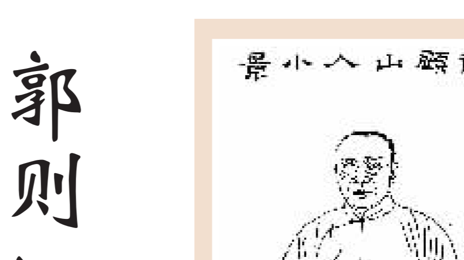
郭则沄的《寒碧篔》诗，原诗为：“寒碧名匪匿，竹木环吾轩。”

1928年5月19日午后，郭则沄又与原班诗友陪父亲游俄国花园，郭曾忻在日记中写道：“园为行宫故址。侗伯云旧称柳墅，湘绮曾游此，有诗，诗中尚有残碑之语。庚子战后，划入俄国租界，俄人遂辟为公园。