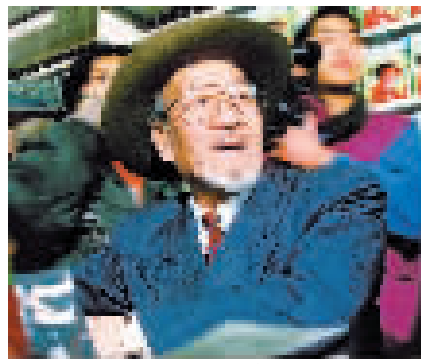
标志性的面庞和着装,这位西部歌王被世人熟知。

夏日的新疆,一辆满载着游客的大巴车上,导游介绍起已故“西部歌王”王洛宾。没想到,一句“达坂城的石头硬又平”起,大家都能接着往下唱。原本各自瞌睡的乘客,突然兴致高涨地齐声合唱《达坂城的姑娘》《掀起你的盖头来》《青春舞曲》。歌声回荡的大巴车里,原先互不熟悉的台湾游客、大陆工作人员,突然好似熟识已久。原来我们都唱过他的歌!