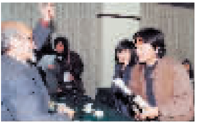
1993年王洛宾(左一)在台举办记者会时,杨忠衡(右一)采访王洛宾

当地,有的后来随部队去了台湾。他们与他们的后代再四散海外,便把王洛宾的歌带到了世界各地。