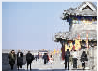
上图 13日,人们在宁夏盐池县的城墙上游玩。