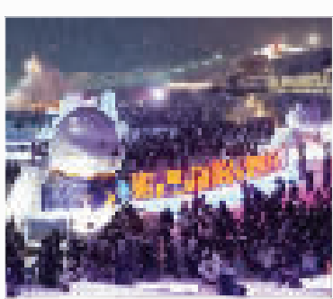
上图 14日,游客在黑龙江省哈尔滨市的“打卡地”冰雪大世界园区内游玩。