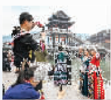
上图 14日,在湖南省湘西土家族苗族自治州凤凰县,游客穿着特色服饰拍照。