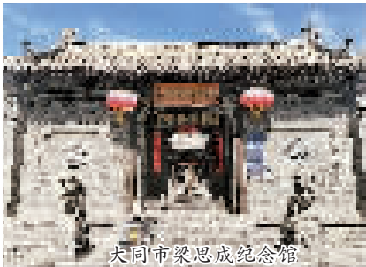
大同市梁思成纪念馆