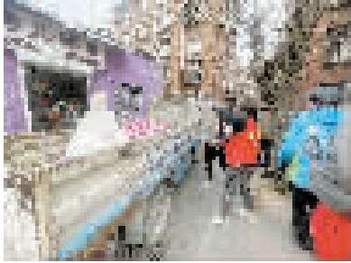
图为天兴里社区志愿者正在清整杂物。

本报讯 和平区多个社区日前集中开展环境清理行动,打造干净整洁社区环境,持续为居民提供精准化、精细化的高质量服务。