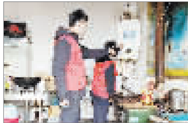
各类安全隐患消灭在萌芽状态。

同时,网格员还通过张贴发放宣传资料、网格微信群推送等方式向村民广泛宣传消防安全知识。对排查中发现存在安全隐患的“九小场所”逐一进行登记,并要求立即整改,限时完成后由网格员进行全面复查整改落实,坚决把