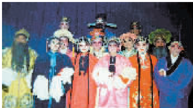
宁河区潘庄镇西塘坨村业余评剧团演出剧照