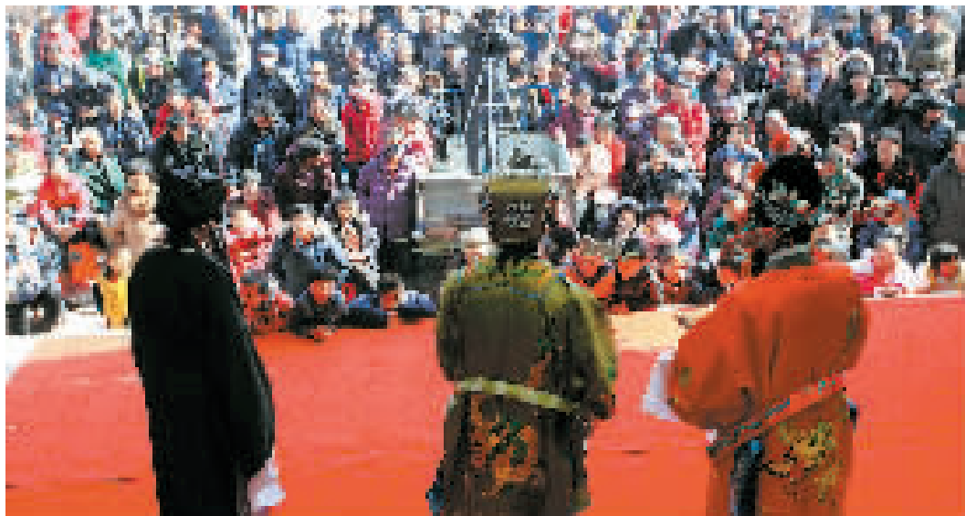
今年春节期间,宁河区七里海镇大八亩坨业余评剧团演出现场。