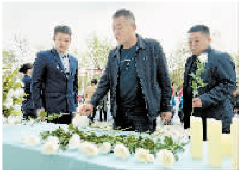
昨日,西青区张家窝镇在家贤里社区举办“文明祭扫展新貌 绿色清明树新风”文明祭祀活动。