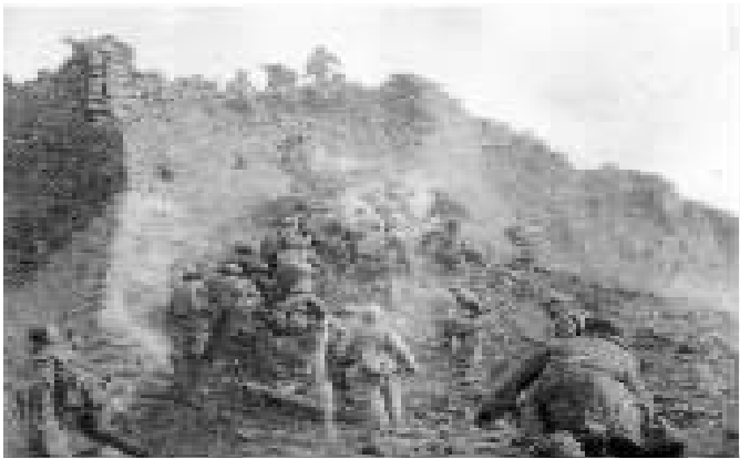
解放军突击队登上新保安城头