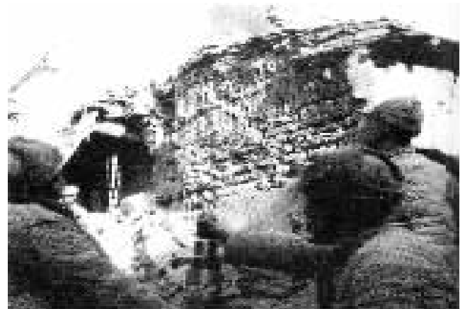
解放军攻入新保安后与敌军展开巷战

歼灭国民党第35军,改变了平津战场的态势,对傅作义集团是一个沉重打击。为其后彻底歼灭平津地区国民党军创造了极为有利的条件。