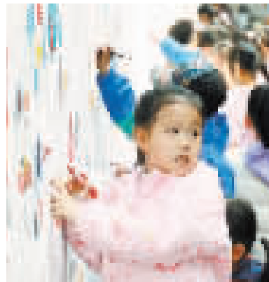
孩子们正在文化墙上绘画。

“共画彩绘墙的意义是通过可视化且具有参与性的活动把人气聚集起来,增进人与人之间的交流,从而实现人与社区之间的连接。”新家园社区工作人员表示。