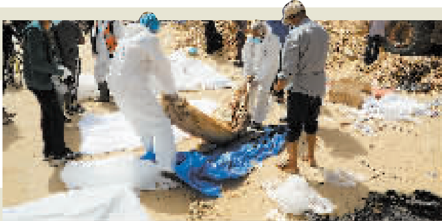
4月23日,工作人员在加沙地带南部城市汗尤尼斯的纳赛尔医疗中心安置尸体。

挖出上述巴方人员尸体,他们由巴方早些时候埋葬。以军以“尊重”方式检查这些尸体,把不属于已死亡被扣押人员的尸体“放回原处”。